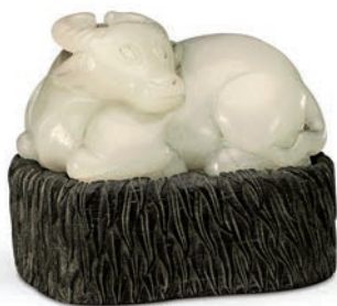
图二〇 清 青白玉十二生肖之玉牛 故宫博物院藏 图采自故宫博物院数字文物库网站