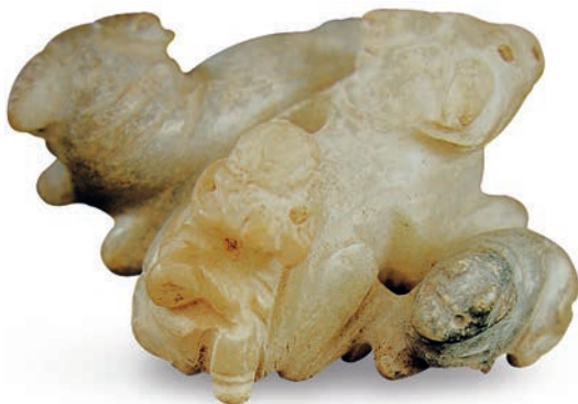
图一七 元 童子牧牛形玉坠 图采自《中国出土玉器全集·第14卷 陕西》第229页

下的牛如同一辙，充满了浓郁的田园气息。两件童子牧牛场景的玉器风格写实，极具画面感，均体现了在舒缓自然的田园生活中，人与牛的亲近之情，表达了人们渴望与自然和谐相处的美好愿望。