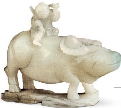
图一八 清 玉牛童 天津博物馆藏