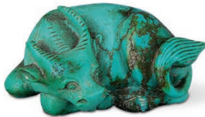
图一九 清 绿松石牛 重庆中国三峡博物馆藏

从古至今，人们爱牛、敬牛，对牛充满了敬意。不同时期玉牛的形象各有特色，从威严肃穆的牺牲，到与人亲近的仁畜，均承载着平安祥和之意，寄托了人们祈求风调雨顺、五