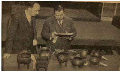
图5 开箱查验文物 ⑫