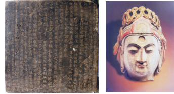
出土的正方形铭砖及贴金佛头像