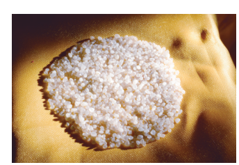
破琉璃瓶中清理出的舍利