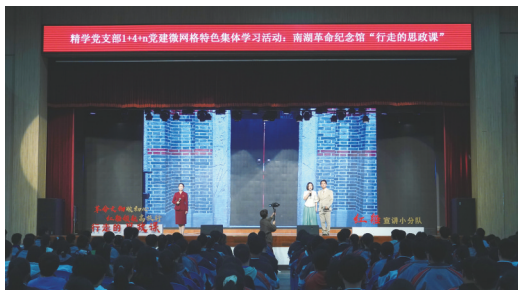
南湖革命纪念馆“行走的思政课”走进高校

2023年12月19日,文化遗产保护传承座谈会在北京召开。会议强调,要认真学习贯彻习近平文化思想,全面加强文化遗产保护传承,更好担负起新的文化使命,为中国式现代化全面推进强国建设、民族复兴伟业注入强大文化力量。座谈会的召开,给红色纪念场馆发展注入了强劲动力,为进一步做好革命文物保护利用和革命精神传承发展工作指明了新方向,提出了新要求。我们要牢牢把握社会主义文化繁荣发展的关键发展期,积极担负起新时代新的文化使命,应时代之需,发时代之声,铸时代之魂,在文化遗产保护传承中体现新担当、展现新作为。