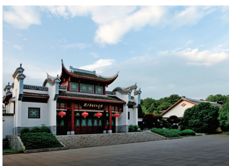
刘少奇同志纪念馆