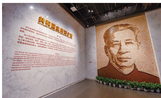
基本陈列“共和国主席刘少奇”

近年来，刘少奇同志纪念馆始终以弘扬少奇精神、传承红色文化为主线，在守正创新的轨道上不断突破传统宣传模式，创立宣传新思路、新话语、新机制，把少奇精神、红色文化与时代发展有机融合，持续扩大少奇精神的影响力。